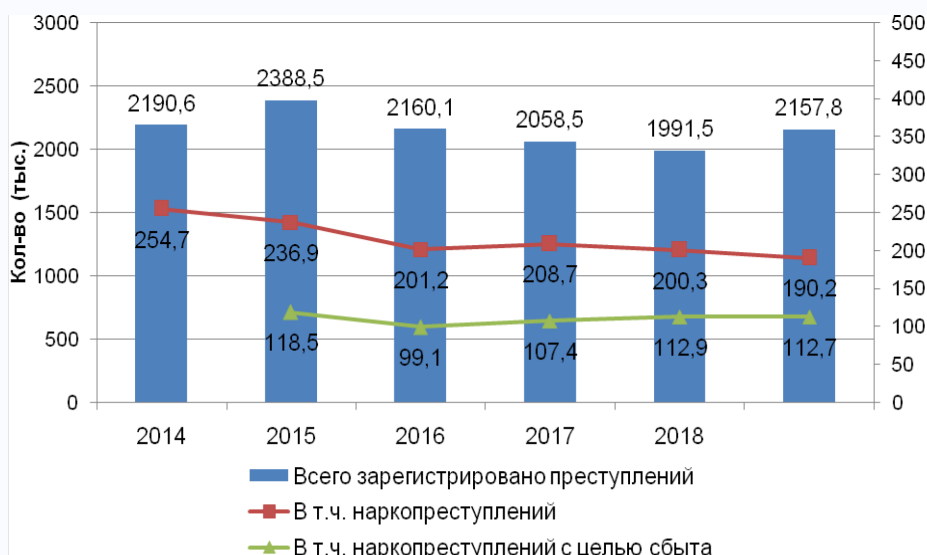
Рис. 3. Доля зарегистрированных наркопреступлений в общем количестве преступлений в 2014-2019 гг.

Социальные процессы, которые протекают в обществе, их интенсивность, направленность, как правило, детерминированы вполне конкретными факторами социальной среды, политики, экономики, образования, воспитания и прочими активизирующими флюидами современного социума. Данные факторы либо прямо, либо косвенно активизируют социальную проблему, ее разрастание или затухание. Задача исследователя – найти этот фактор, оптимально использовать его потенциал (либо положительный, либо отрицательный) для принятия управленческого решения. Особое значение приобретает оценка криминологической составляющей факторов, детерминирующих социально негативные процессы в обществе, способствующих криминализации социальной среды. Данная оценка предполагает обоснование уровня силы, направленности и качества возможного рассматриваемого влияния. Рассматривая то или иное социальное явление, очень сложно говорить об уровне его проявления в обществе. В связи с этим оценка происходит по серии взаимосвязанных, взаимодополняемых индикаторов, измеряющих наблюдаемое явление или процесс как бы в целом. Таковыми выступают наркотизм и наркоситуация как некие включения в социальную реальность.